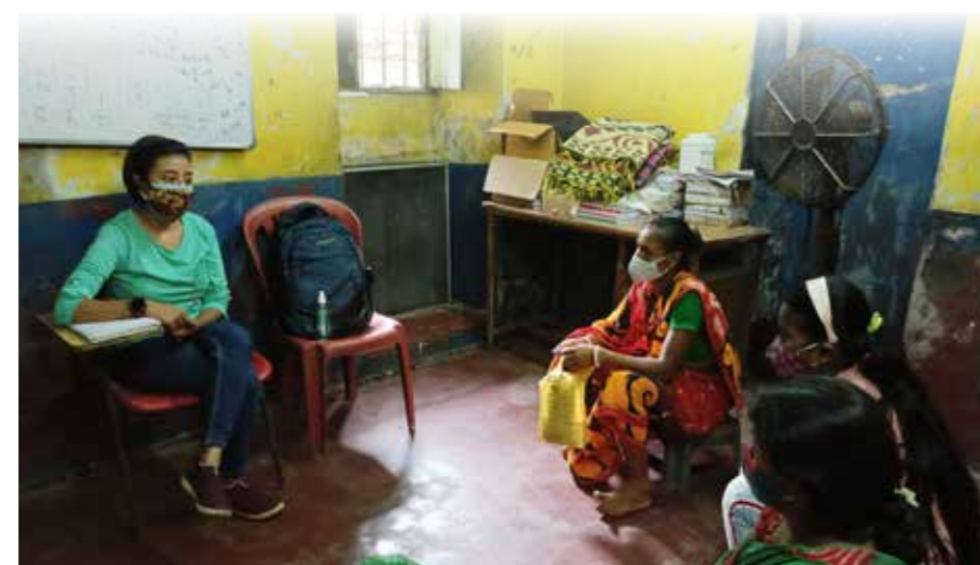
Suchandra bei der sozialen Arbeit

Sie möchte in ihrer Gemeinde im Bereich Geschlechter- und Frauenförderung arbeiten und bereitet sich auf die Prüfung für die Klasse 12 vor.