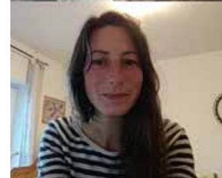
Gemeinsame Online-Physiotherapiestunde

Ich gebe Hinweise, wenn ich etwas bemerke, frage tiefergehend und bin Ansprechperson bei fachlichen Unklarheiten. Ich freue mich über diese Form der Kooperation und Unterstützungsmöglichkeit. Seit einigen Wochen werden nach und nach auch wieder ein paar wenige Patienten in der Talapark Ambulanz unter Sicherheitsvorkehrungen persönlich behandelt.