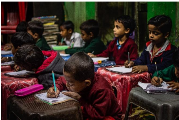
Schüler*innen in einer Bildungseinrichtung von Calcutta Rescue.

Die Jugendberufsberatung findet gemeinsam mit den Schüler*innen Interessen und Kompetenzen, um den zukünftigen Berufseinstieg selbstbestimmt vorzubereiten und zu erleichtern. Neben der Schulsozialarbeit mit psychologischer Beratung und aufsuchender Arbeit werden Mädchen präventiv in Gruppenangeboten hinsichtlich sexueller Gewalt sensibilisiert. Das ‚Gender Equality Program‘ leistet u.a. mit Freizeitangeboten in Jungen- und Mädchengruppen wichtige Arbeit für die Gleichberechtigung.