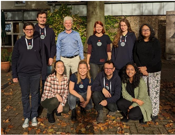
Mitgliederversammlung CRD 2022 in Bochum

Tuberkulose-Patient*innen in Kolkata und der ländlichen Umgebung. Es existieren ein HIV-Programm und Initiativen zur medizinischen Versorgung in Slumgebieten aus zwei mobilen Ambulanzen heraus. Eine Übernahme dieser Patient*innen in die regulären Ambulanzen oder Krankenhauseinweisungen sind möglich, falls dies nötig sein sollte. Ebenso werden Familienbetreuungsprogramme (Familienplanung, vor- und nachgeburtliche Versorgung) und zwei Bildungseinrichtungen mit 650 Schulkindern und diverse Ausbildungsprogramme betrieben.