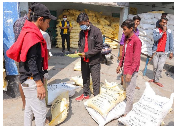
Im Rahmen des „Dry Foods“ Projekt konnten 3.750 Tonnen trockene Nahrungsmittel verteilt werden.

Die Wirtschaft erholte sich langsam, jedoch waren die Auswirkungen auf die Ernährungslage der Menschen verheerend. Es mangelte vielen Menschen in Indien an genügend finanziellen Mitteln für ausreichen und vor allem gesunde Nahrung, sodass Indien im Welt Hunger Index stark zurückfiel. Im Rahmen des „Dry Food“ Projekt konnten mit Hilfe der Citibank fast 4.000 Tonnen trockene Nahrungsmittel (Linsen, Reis etc.) an 75.000 Haushalte in über 50 Slums von Calcutta Rescue verteilt werden.