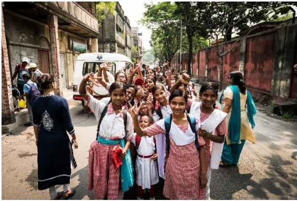
Die Schüler*innen der Bildungseinrichtungen von Calcutta Rescue freuen sich, dass sie endlich wieder in die Schule können.

allem online statt. Auch die Bildungs- und Sozialarbeit-Projekte machten im Jahr 2022 weiter Fortschritte. Als wichtiger Punkt wurde vor allem die Aufrechterhaltung der mentalen Gesundheit der Kinder forciert, wobei vor allem auch die Eltern mit einbezogen wurden, damit sich diese ihrer Verantwortung bewusst werden. Die Kinder konnten schließlich nach fast 2-jähriger Schulschließung zum Präsenzunterricht zurückkehren nachdem die Regierung von Westbengalen am 16. Februar 2022 endlich grünes Licht für die Wiedereröffnung gegeben hatte.