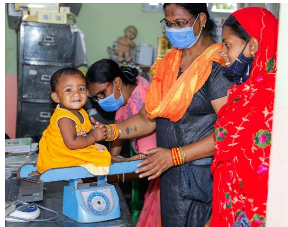
Schwangere, junge Mütter sowie Säuglinge erhalten regelmäßige medizinische Versorgung.

postnatale Nachsorgeuntersuchungen sowie Unterricht zu den Themen Hygiene, Ernährung, Stillen und Familienplanung.