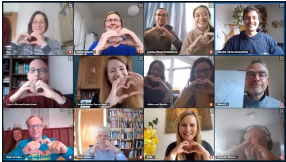
Virtuelles Frühjahrstreffen 2022